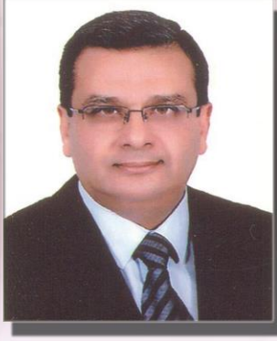
أ.د/ هشام محمد محمد أبو العينين نائب رئيس الجامعة لشئون الدراسات العليا والبحوث