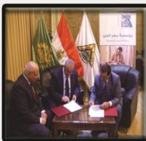
بروتوكول تعاون بين جامعة بنها ومؤسسة مصر الخير