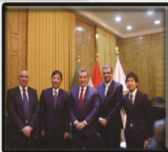
زيارة السفير الياباني لجامعة بنها