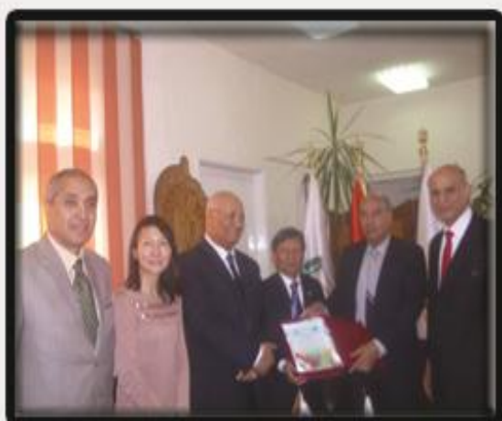
جامعة بنها تستقبل رئيس جامعة شيان